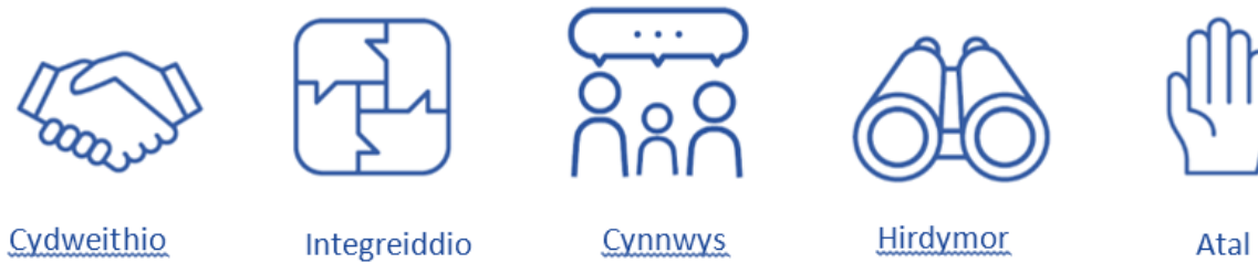
Ffigur 1: Y 5 ffordd o weithio o Ddeddf Llesiant Cenedlaethau'r Dyfodol

Yn union fel pan oeddem ni'n paratoi'r Asesiad Lles, rydym wedi defnyddio'r pum ffordd o weithio, cydweithredu, integreiddio, cynnwys, tymor hir ac atal, i arwain ein gwaith. Mae hyn yn golygu, wrth ystyried sut i wella llesiant yn ein cymunedau nawr, rydym ni hefyd wedi edrych ar sut y gallai llesiant gael ei effeithio yn y dyfodol a sut y gallwn atal materion rhag gwaethygu. Bydd angen i ni weithio gyda'n gilydd i weld beth rydyn ni'n ei wneud mewn cymuned a sut mae hyn yn effeithio ar yr hyn rydyn ni'n ei wneud, yn unigol ac mewn partneriaeth. Yn olaf, ond yn bwysicaf oll, rydym am i'n cymunedau, gweithwyr proffesiynol, busnesau, ac eraill nodi'r materion sydd bwysicaf iddyn nhw. Wrth i ni ddatblygu sut y byddwn ni'n cyflawni'r Amcanion a'r Camau (cynlluniau cyflenwi rhanbarthol a lleol) byddwn yn parhau i ddefnyddio'r egwyddorion hyn i lywio ein gwaith.